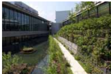
中庭のビオトープ池