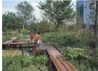
普段は憩いの場として