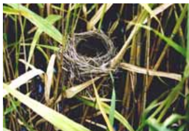
オオヨシキリの巣