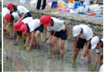
小学生参加による田植え