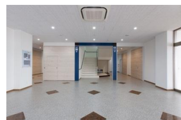
1F エントランスホール