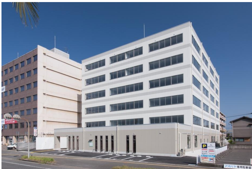
新『大分鉄鋼ビルディング』全景

新ビルの建設は旧ビルの駐車場スペースで行われ、今後は順次旧ビルからのテナントの移転を進めるとともに、12月の当社大分事業所の移転を最後に、2016年1月より旧ビルの解体工事に着手。解体後の敷地については、新ビルの駐車場として再整備の上、2016年12月に全施設が正式稼働となる予定です。