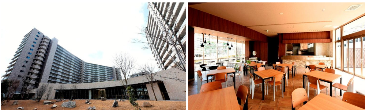
「ミリカ・テラス」竣工写真（左：外観、右：食堂）

このニュースリリースに関するお問い合わせ先 株式会社大京 広報室（齋藤） TEL:03-3475-3802