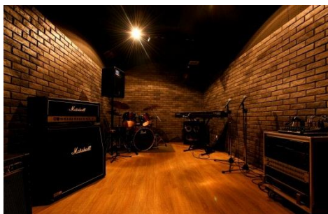
【ミュージックスタジオ】 防音仕様でドラムセットも完備