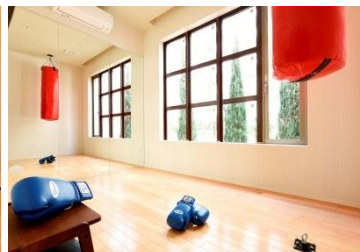
【フィットネススタジオ】 みんなで運動を楽しめます