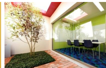
【キッズミーティング】 グループ学習や課外学習に