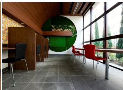
【スタディラボ】 みんなで使える学習施設