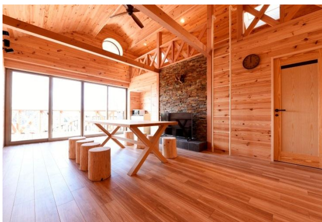
【ログハウス】 気軽にアウトドア体験ができる宿泊施設