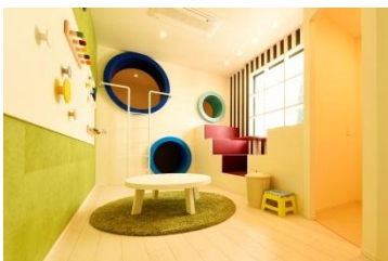
【キッズハウス】 子どもたちにお泊り体験を