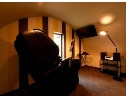
【フリーカプセル】 一人で音楽や映画をゆったり楽しむ空間