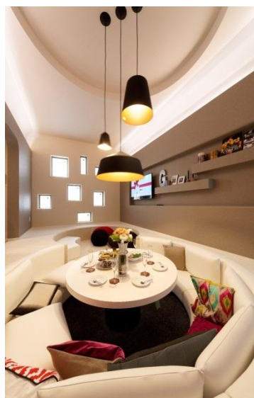
【女子会ルーム】 一晩中おしゃべりを楽しめる空間