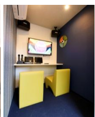
【カプセルカラオケ】 一人レッスンも