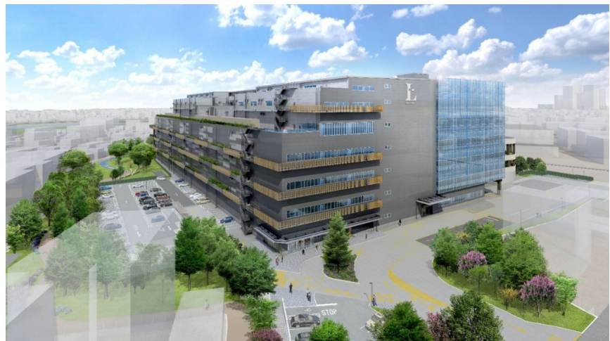
▲外観完成予想パース

当社がこれまで取り組んできた物流施設開発の知見を活かしながら、物流ニーズだけでなく研究開発機能の高度化・都市近接化や既存工場の老朽化を背景とした R&D・工場ニーズにも応えるべく、2028年春の完成に向けて開発を進めてまいります。本開発を通じて、産業インフラの高度化と地域連携を図り、持続可能なまちづくりを推進します。