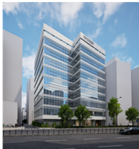
▲ 『(仮称) BIZCORE 秋葉原計画』 外観完成予想 CG