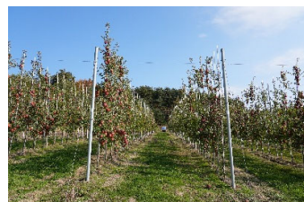
▲高密度植栽の様子