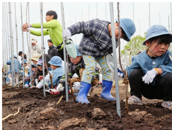
▲近隣の幼稚園児による定植体験イベントの様子