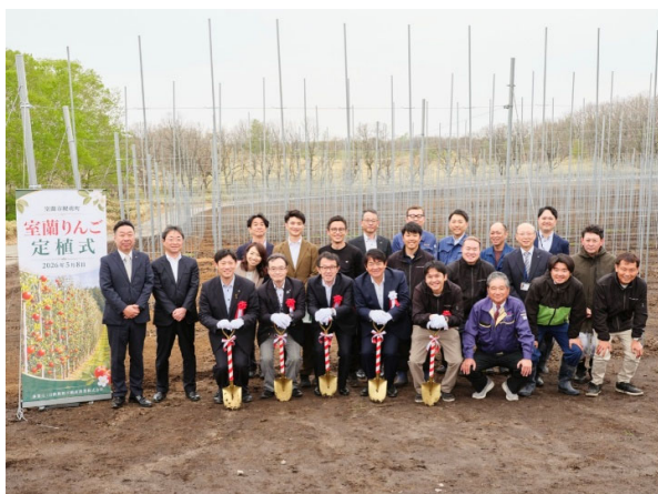
▲定植式にご参加された皆さま