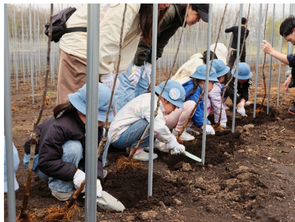
▲近隣の幼稚園児による定植体験イベントの様子

今期は、約5haの農地の内、26年度開園分0.75haにて「ふじ：1,029本」「ぐんま名月：2,142本」「シナノスイート：28本」の合計3品種：3,199本を植える予定です。高密度植栽培は早期多収が特徴であり、翌々年の2028年には少量の収穫・出荷が可能となる見込みです。また、樹が成長し、収穫量が安定して最大化するのは定植から約6年目（2031年頃）を想定しています。