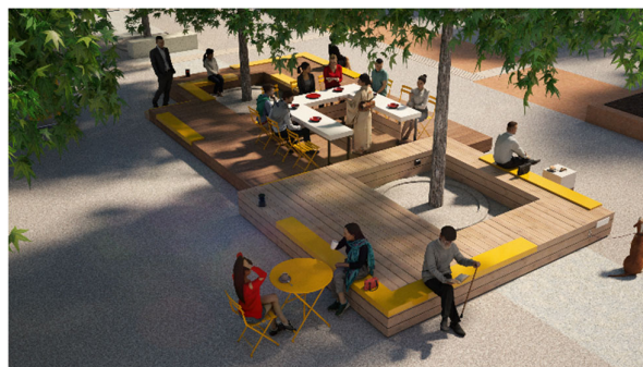
▲今回新たに設置するウッドデッキのイメージ

使用するデッキには SATO COMPANY のアップサイクルパレット「MARUPA (マルパ)」と西川バウム合同会社の埼玉県産の「西川材」を 100%使用した木質化ユニットを導入しています。実証実験終了後も廃棄せず別の用途へ二次利用できる「使い継がれる」設計としており、環境負荷を抑えた持続可能な都市緑地の在り方を提示します。