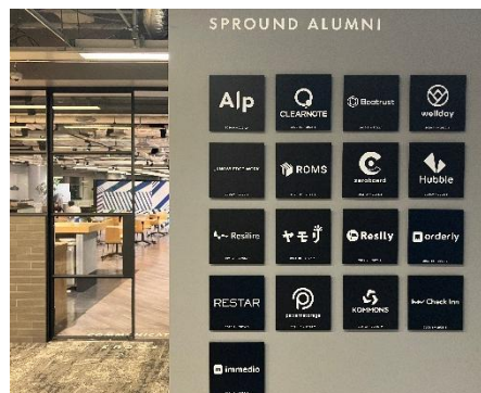
卒業企業を掲示する「ALUMNI WALL」