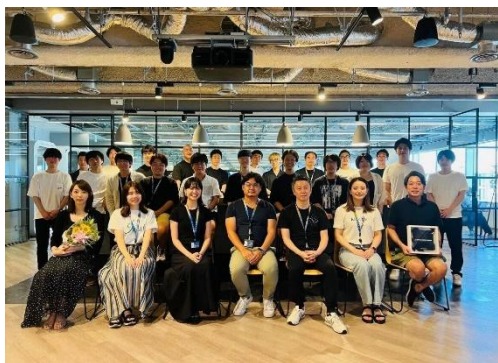
卒業したスタートアップ企業の皆さんと『SPROUND』運営メンバー