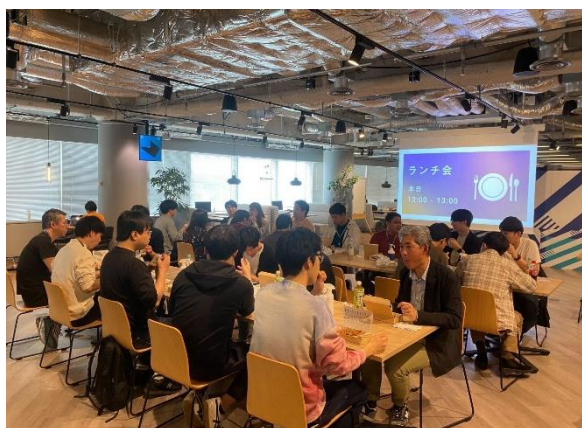
コミュニティづくりのためのランチ会

四半期ごとに開催する“経営者座談会”では、CEO ならではの悩みや課題について、企業フェーズを超えて実践的な知見をシェアする場となっています。また、気軽に昼食時間を共有しながら情報交換を行う“ランチ会”や、利用者が集まりカジュアルにコミュニケーションをとることができる“SPROUND BAR”、終業後にリフレッシュできる“SPROUND 部”では、企業・職種の垣根を超えたラフな情報交換の場として機能しています。