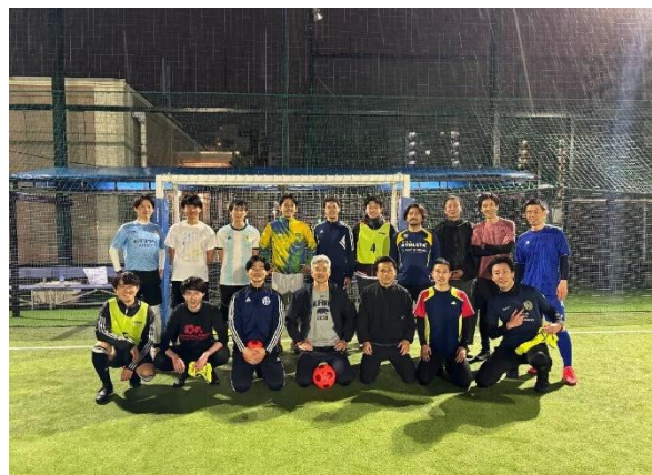
身体を動かしながら交流できる SPROUND フットサル部