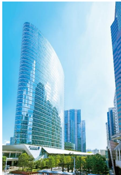
品川インターシティ