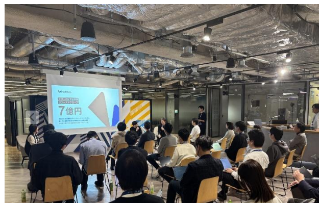
調達の裏側を聞く資金調達ストーリー

『SPROUND』では、スタートアップ企業が抱えがちな組織開発・顧客開発・営業手法等の構築の一助となるセミナー・ワークショップを、DNX 監修のもと開催してきました。同じ B2B SaaS 領域で成功を収める先輩経営者や各種専門家などを招いて開催した学びの機会は、通算 70 回を超えました。資金調達ストーリーでは、アップラウンドを実現した企業が調達の裏側を振り返りながら、次世代経営者に学びを届けています。また、『SPROUND』で開催した勉強会は可能な範囲でアーカイブを作成し、いつでもどこでも学びの機会にアクセスできるよう会員限定でポータルサイト（ナレッジポータル）を公開しています。