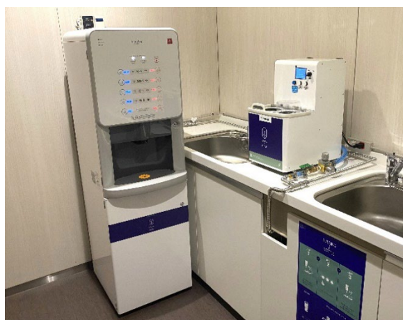
▲（左から）給湯室に設置した 給茶機とマイボトル洗浄機

これらのマイボトルを使って節約したいというニーズと、洗浄の手間、清潔さなどの不満の両方に応えることで、「実現可能な環境アクション」の提供を目指します。