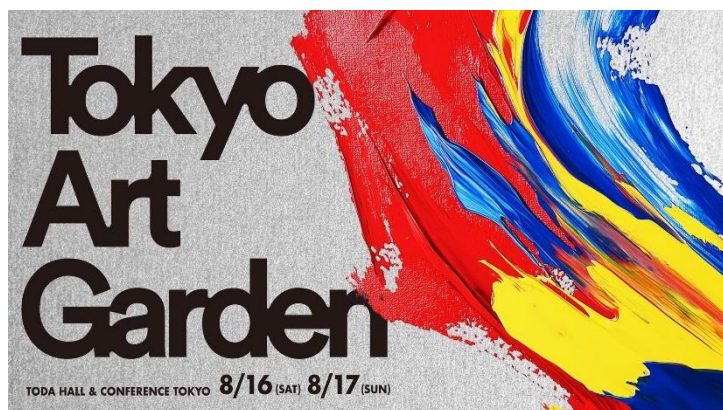
「Tokyo Art Garden」ロゴ

日鉄興和不動産株式会社（本社：東京都港区、代表取締役社長：三輪 正浩、以下「当社」）は、2025 年 8 月 17 日（日）に TODA HALL & CONFERENCE TOKYO（東京都・中央区）で開催されるアートイベント「Tokyo Art Garden」へ出展・協賛いたします。