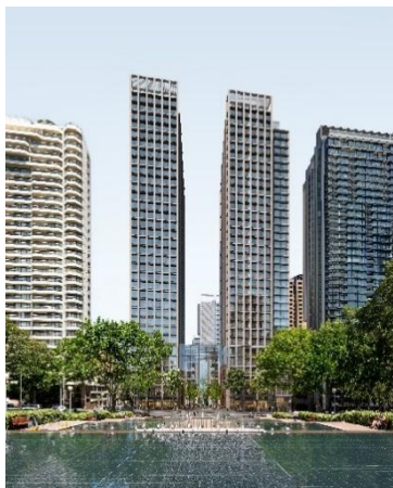
▲「175 Liverpool Street」完成イメージ