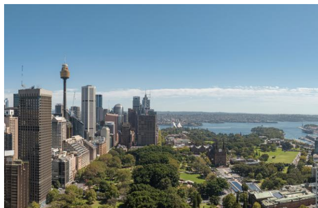
▲既存オフィスビルからの眺望写真

オーストラリアは安定した経済成長と人口増加が続き、今後も住宅需要の増加が見込まれています。また人口増加に伴い住宅供給不足が深刻化していることから、今後も更なる住宅市場の拡大と持続可能な発展が期待されています。