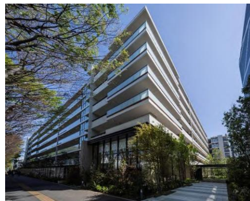
建替え後 『リビオシティ船橋北習志野』