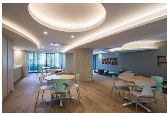
コミュニティルーム