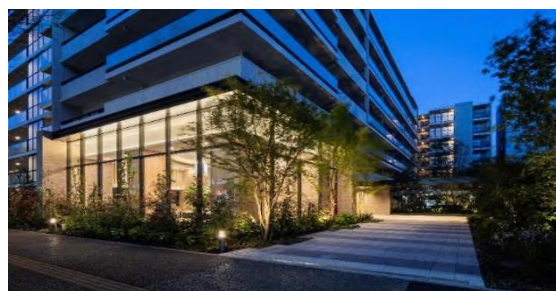
メインエントランスホール・アプローチ