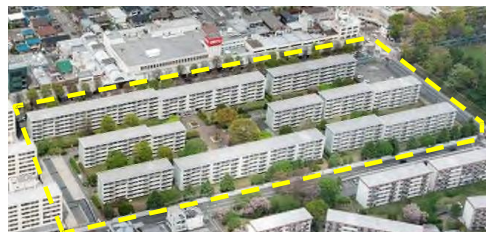
建替え前 「習志野台三街区住宅団地」

『リビオシティ船橋北習志野』は地上 7 階建・4 棟、全 488 戸の大規模マンションです。南向き中心の配棟、広大なコミュニティガーデン（約 1,900 ㎡）を含め 50%超の空地率を確保し、駅前立地でありながら、良好な住環境を実現いたしました。