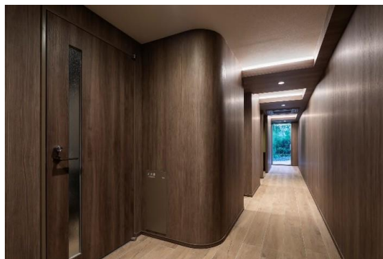
パーソナルブース