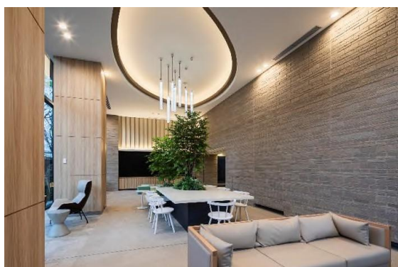
メインエントランスホール