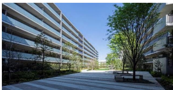
コミュニティガーデン