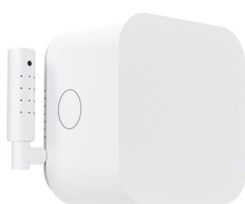
「スマートリモコン」