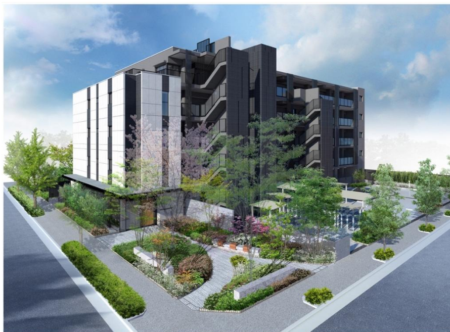
完成予想 CG ※3

物件名 : (仮称) リビオ篠崎 所在地 : 東京都江戸川区篠崎町 5 丁目 70 (地番) 交通 : 都営新宿線「篠崎」駅 徒歩 8 分 敷地面積 : 1,483.33 m 2 (448.70 坪) 構造・規模 : RC 造 地上 5 階建 総戸数 : 32 戸 竣工予定 : 2026 年 2 月 引渡時期 : 未定 間取り : 2LDK / 3LDK / 4LDK 住居専有面積 : 62 m 2 ~84 m 2 物件 H P : 未定