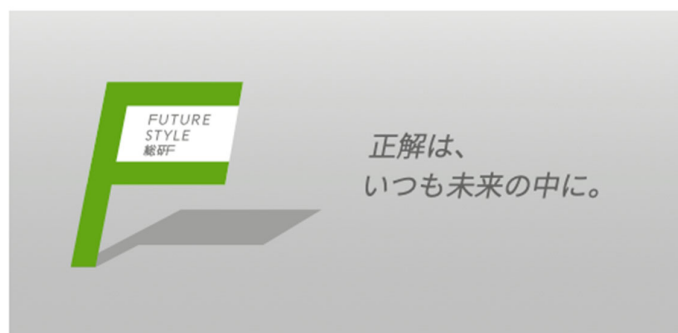
▲『Future Style 総研』ロゴ

日鉄興和不動産株式会社（本社：東京都港区、代表取締役社長：三輪 正浩、以下「日鉄興和不動産」）は、総合研究所『Future Style 総研』を、2025 年 4 月 1 日に設立したことをお知らせいたします。