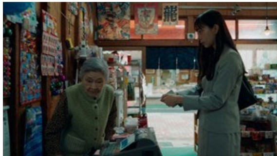
▲ブランデッドムービー『I THINK』より