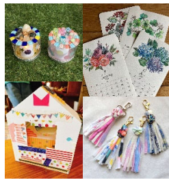
▲クラフトワークショップ