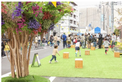
▲芝生エリアイメージ