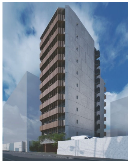
▲『(仮称)リビオメゾン浅草橋』外観イメージ ▲『(仮称)リビオメゾン東陽町』外観イメージ

日鉄興和不動産は、“人生を豊かにデザインするためのマンション”をコンセプトにしたマンションブランド「リビオ」を展開しており、「リビオメゾン」は賃貸マンションシリーズになります。