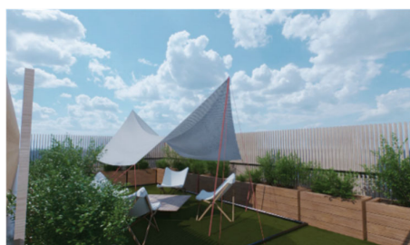
▲「屋上テラス」イメージ