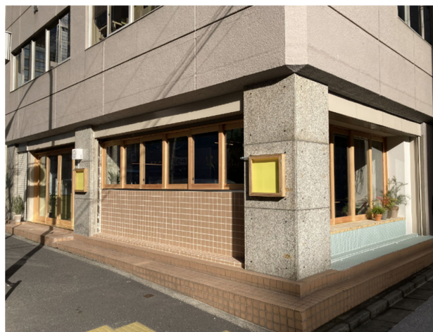
「Sustainable Food Museum」外観