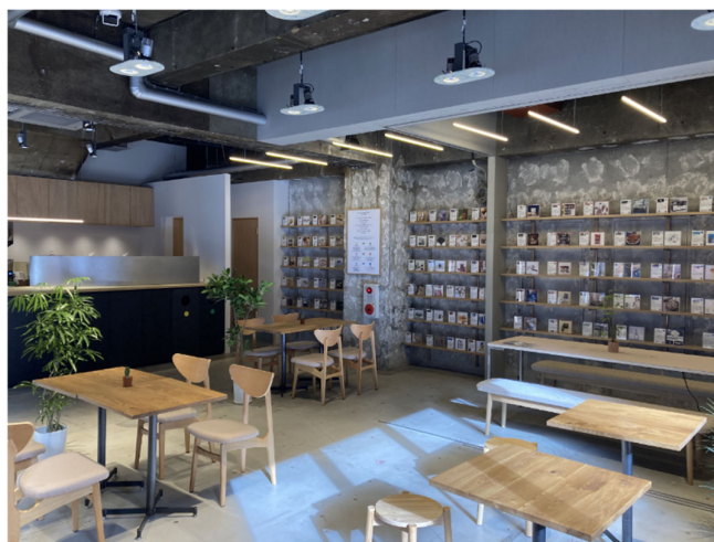
「Sustainable Food Museum」内観