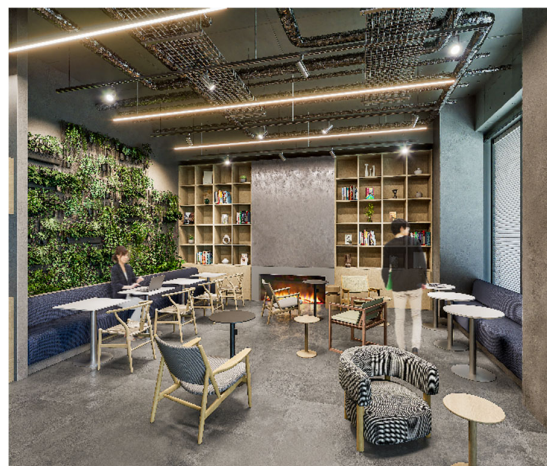
▲多目的室完成予想図