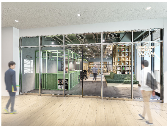
▲エントランス完成予想図

なお、本日 1 月 22 日（水）より、『WAW 大宮』のシェアオフィス・コワーキングの入居者募集を開始し、開業に先立って開催するルーム会員検討者向け内覧会、プレオープン体験会、サウナトークイベントへの参加受付を開始いたします。