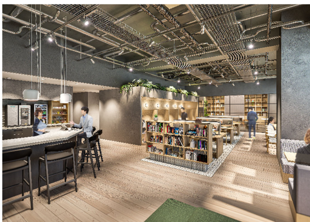
▲ラウンジ完成予想図

埼玉を拠点とする企業の本拠地として、大手企業の支店として、大宮を中心に活動する個人事業主や自宅以外でリモートワークをしたい会社員の拠点として、さまざまなビジネスシーンに貢献いたします。