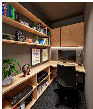
▲1人用個室完成予想図