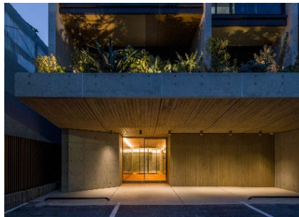
▲エントランス（外側）