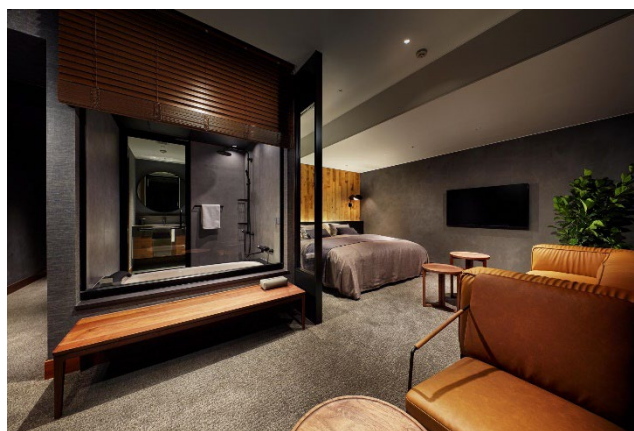
5 階 ゲストルーム「Kirameki(きらめき)」