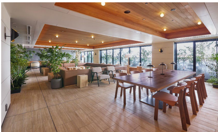
5階 ウェルカムラウンジ

ウェルカムラウンジは、ラグジュアリーホテルと同等の上質な家具に加え、掘り込み植栽・POT植栽を配置することで、ぬくもりのある心地よい空間を実現しました。コーヒーマシンの設置やコンシェルジュによる各種取次サービス、大日本印刷株式会社が厳選した書籍の設置(年に数回入れ替え)などのソフトサービスも充実しており、単なるラウンジではなく、居住者のサードプレイスとして憩い・交流・仕事などさまざまなスタイルで過ごしていただけます。