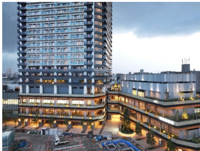
本建物外観(基壇部)

本複合再開発では、地上39階建の超高層タワーを建設、地域の賑わいや交流をはぐくむ駅前広場をはじめ、地元の活気を生み出す店舗や商業施設・公益施設、地下には公共駐輪場などを整備いたします。地域の既存価値と未来価値を繋ぐ親和性を意識した、大らかで温かみのある「Wood & Green」をランドスケープデザインのコンセプトに据え、緑豊かな街路樹、メッシュプランターによる側面緑化、成長により建物を覆うツル性植物などを配し、地域の緑化にも貢献することで、都心景観と自然が美しく調和し、駅前に心地よい集いと憩いの場を提供します。駅前に新たな賑わいと緑豊かな空間を創出することで、災害対応力の強化と十条のさらなる賑わいと魅力向上を実現しています。