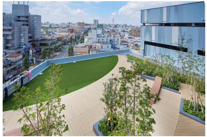
4階 ルーフガーデン