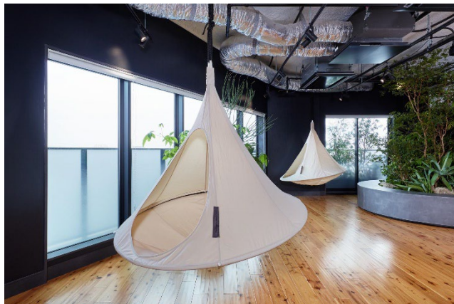
ハンモックを設置