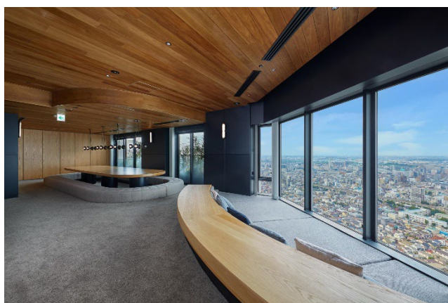
37 階 スカイラウンジ

東芝エレベータ株式会社と大日本印刷株式会社が提供するデジタルサイネージをエレベーター内に導入し、ニュースや天気、暮らしに役立つ情報を配信することで、居住者の方々の生活利便性を向上させます。さらに、マンション内の定期点検のお知らせなどの掲示板情報の放映も可能で周辺地域やマンション管理会社とのコミュニケーション促進につながります。