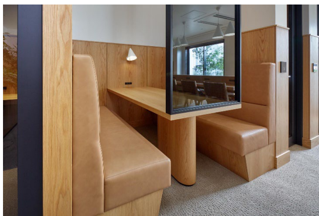
ミーティングブース