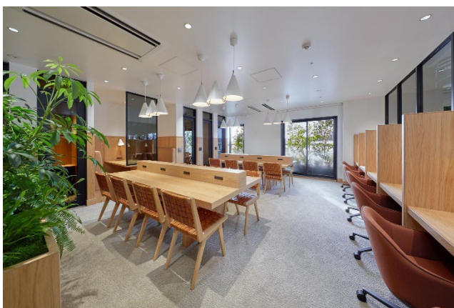
5階 ワークラウンジ

フォレストパークに隣接するワークラウンジでは、リモートワークや勉強などに必要な電源・Wi-Fiといった機能を備えつつ、過ごし方に合わせて「オープンテーブル」「プライベートデスク」「ミーティングブース」「プライベートブース」の4つからお選びいただけます。ウェルカムラウンジからコーヒーの持ち込みが可能となっており、快適なワーク環境をご提供いたします。