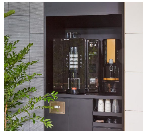
コーヒーマシンを設置