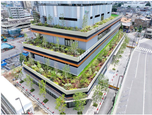
本建物側面 ステップガーデン