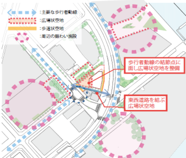
□エリアの回遊性に寄与する空地の設定