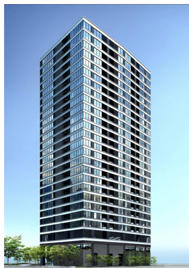
▲建替え後、外観完成予想 CG ※今後の諸官庁協議・合意形成・経済情勢等により変更となる場合があります。

※1 東京都のマンション建替法に基づく容積率の特例緩和制度：「除却の必要性に係る認定」（耐震性不足の認定）を受けたマンションの建替えで、新しいマンションの計画において公開空地等の整備により防災、環境など総合的に地域への貢献が認められると特定行政庁（港区）が判断した場合に容積率が緩和される。