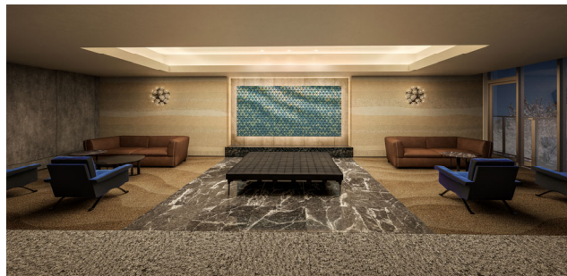
▲「オーナーズラウンジ」完成予想 CG