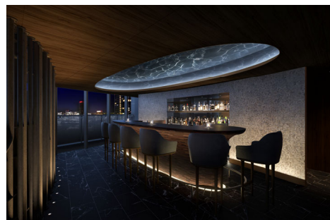
▲「スカイラウンジ」完成予想 CG

さらには、街との調和を目指し、豊かな緑と共に水や風・人の流れをデザイン。周辺地域への豊かな自然環境の提供を目指し、生物多様性保全に配慮した ABINC 認証（※2）、緑の保全・創出への取り組みを評価する SEGES 認定（※3）をとともに取得。加えて、快適性と省エネを両立する ZEH-M Oriented 基準を満たし、地球環境に配慮する認定低炭素住宅の認証を取得するなど、未来を見据えた住まいの環境性能を整えます。