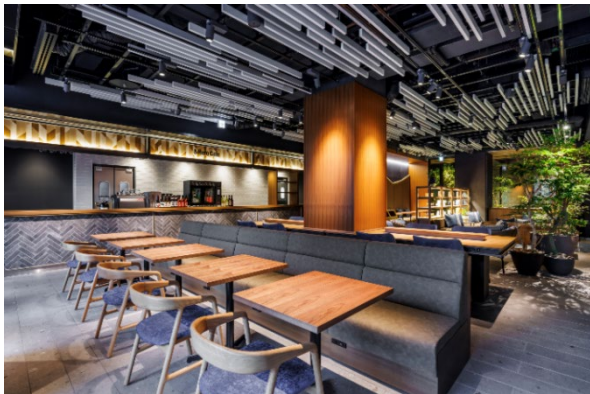
▲エントランスラウンジ

※1：2024年3月、東京・上野に開業したレジデンシャルホテル「&Here（アンドヒア）」の第1号ホテル https://www.nskre.co.jp/company/news/2024/03/docs/20240313.pdf