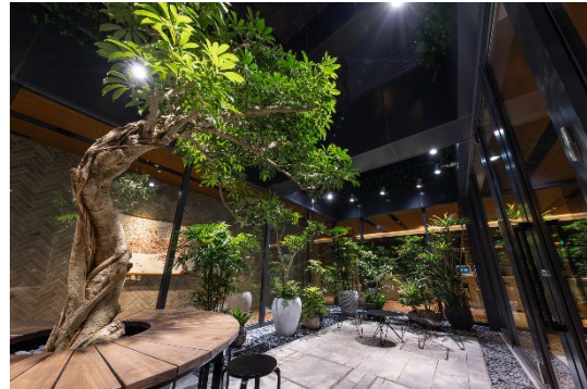
▲緑に囲まれたテラス