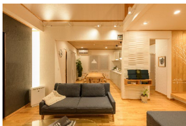
朝・起床 30 分前：目覚めを促すように徐々に明るく