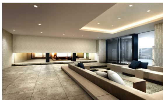
ラウンジ完成予想 CG

本物件は、駅周辺のにぎわいからも程よく離れた落ち着いた住宅地エリア、バス通りとなる道路からも一歩奥まった第一種住居地域「北栄」に誕生します。また、浦安市内で唯一、埋立地ではない元町地域と呼ばれる場所に位置しています。※1