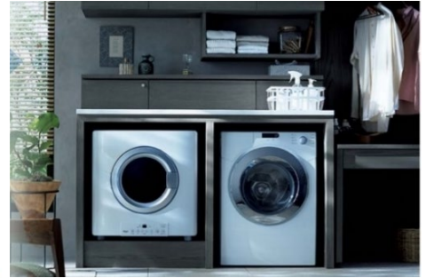
(メーカー参考写真)