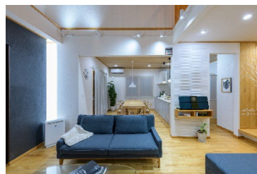
朝・起床時：覚醒を促す白くて明るい自然な光