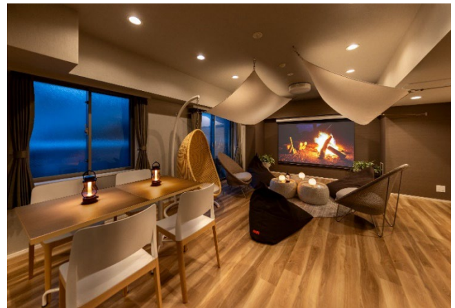
▲「+ONE シェアラウンジ」内観