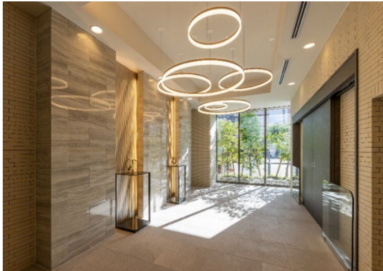
▲エントランスホール