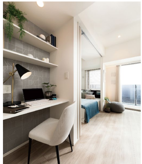
▲「リモデスク」イメージ