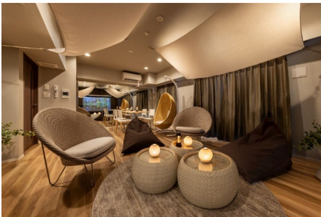
▲「+ONE シェアラウンジ」内観

100インチの大型スクリーンや手洗い水洗いを装備し、友人を招いてのホームパーティや映画鑑賞、鏡張りの壁を利用して体を動かす空間としてもご利用いただけます。