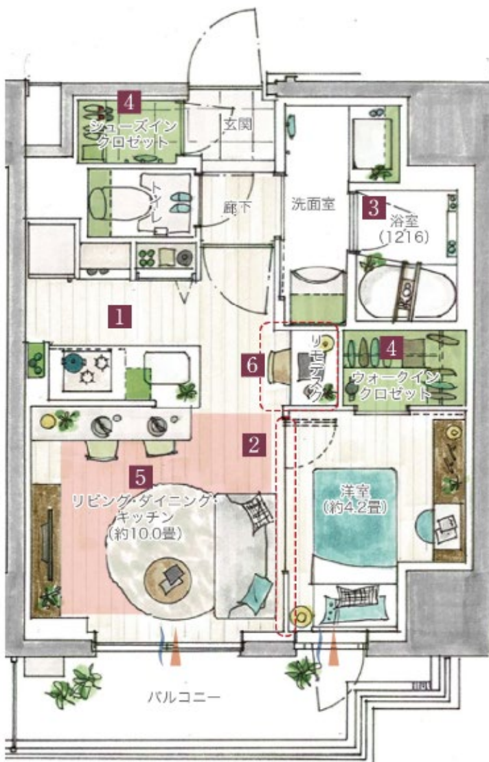
▲【例】A type 1LDK・WIC・SIC 専有面積 37.68㎡

全戸数の 60%超を占める 1LDK の住戸では、専有面積 30.19㎡、37.68㎡の 2 タイプを、また 2LDK 専有面積 44.02㎡の 2 人世帯用のプランもご用意しました。コンパクトでありながら、居室の一角にリモートワーク時のデスクとして使えるカウンターを省スペースで実現した「リモデスク」を導入するなど、新しい時代のライフスタイルを提案しています。