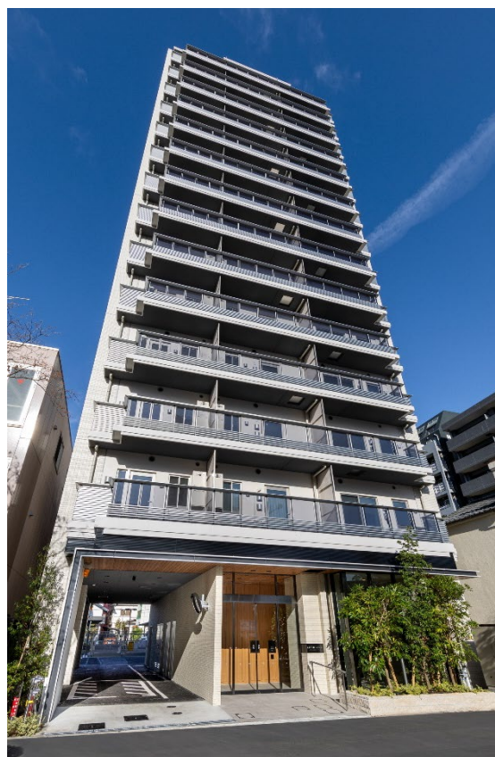
▲『リビオレゾン八王子レジデンス』外観

『リビオレゾン八王子レジデンス』はJR「八王子」駅を最寄り駅とし、駅北口の商業エリアと住宅中心エリアの利便性と住みやすさが両立するバランスの良い立地に誕生します。またJR「八王子」駅前は再開発が著しく、企業や研究機関による産学連携の新たな拠点が誕生するなど新たなにぎわいを見せる場です。JR中央線通勤特快利用で「新宿」駅まで直通35分（日中）という利便性も兼ね備え、資産性と住環境に優れた場所と言えます。