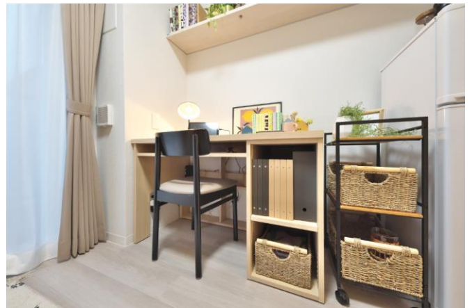
専有部（アクタスオリジナルデスク）