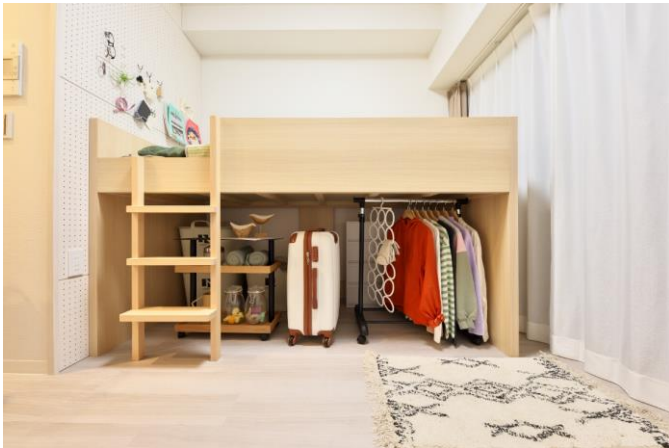
専有部（アクタスオリジナルストレージベッド）