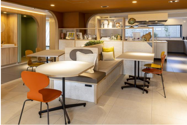
1階共用部（カフェテリア）

学生が実際に使用し、環境配慮を重視した家具の開発とその後のリペア、リユース、リサイクルの具体例を学ぶことができる場面を提供することで、SDGs をより身近に体感できる取り組みとなりました。