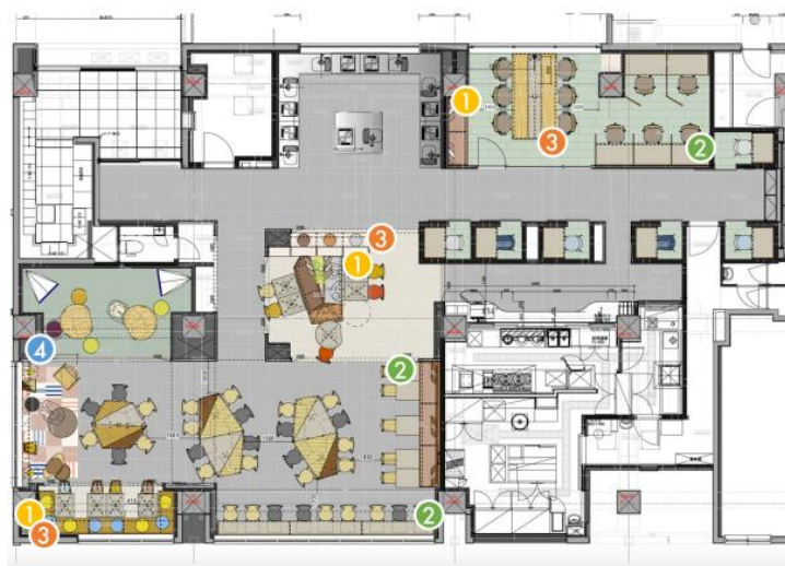
マテリアルキャプションプロット図