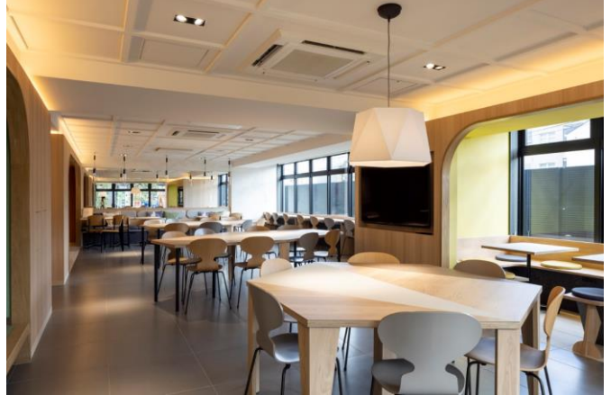
1階共用部（カフェテリア）