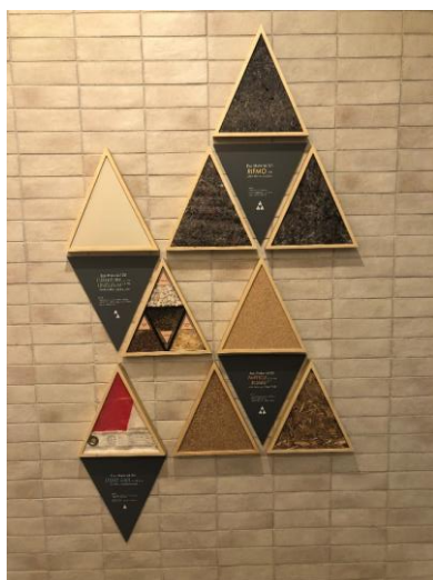
マテリアルパネル

2022年に竣工した「キャンパスヴィレッジ大阪近大前」においても、1階の共用部に入居者が日々の生活の中で循環型経済「サーキュラーエコノミー」を身近に感じ、学ぶことができるような空間作りを行うなど、学生レジデンス「CAMPUS VILLAGE（キャンパスヴィレッジ）」シリーズでは、入居学生が環境取り組みを学ぶきっかけになるような仕掛けを積極的に提供しております。