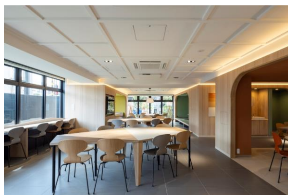
1階共用部（カフェテリア）