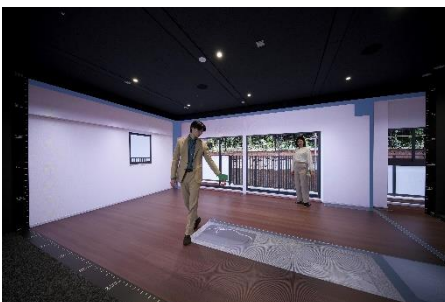
▲リアルサイズスクリーン

さらにオンラインの活用として、2021年にローンチした、マンションのオンラインストア「sumune」に本サロンで販売する物件を掲載。オンライン相談はもちろん、本人確認、ローン審査、申し込み、契約手続きなどを、オンラインの良さを活かしいつでもどこでも行えるよう今後整えてまいります。