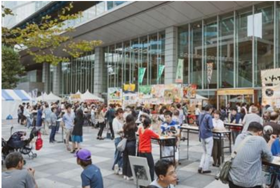
▲「品川インターシティ」で開催されたイベントの様子