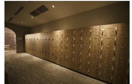
▲ロッカースペース