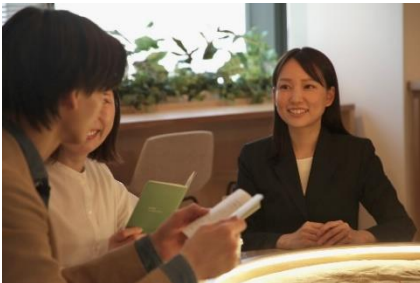
▲ライフデザイナーによるご相談

また、本サロンは来て頂くお客さまが存分にリラックスしてご体感、ご相談して頂ける工夫をしています。ご案内が付かないフリーでの見学や、営業をしないライフデザイナーによるサポート、靴や荷物をお預けいただけるロッカースペース、キッズスペース併設のご相談スペースや、手洗い付きのおむつ替えスペースや授乳室、プライバシーに配慮した個室から閉塞感の無いオープンな席のご用意、リラックスをテーマにしたオリジナルの香りや音楽、こだわりのコーヒーのご提供など、ホスピタリティにこだわった空間、サービスを提供いたします。