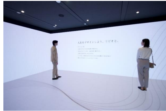
▲リアルサイズスクリーン