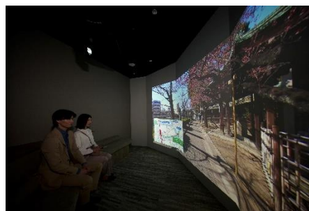
▲ライフデザインシアター