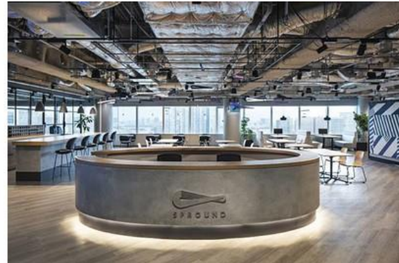
▲インキュベーションオフィス「SPROUND」