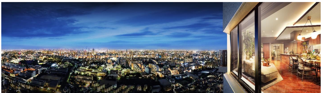
眺望合成外観完成予想 CG

エリア最高層 ※1 として誕生するタワーレジデンスならではの眺望。遮るものがない全方位に澄み渡る開放感と、周囲に開かれた都心の景色を贅沢に一望できる特別な暮らし心地を創出します。