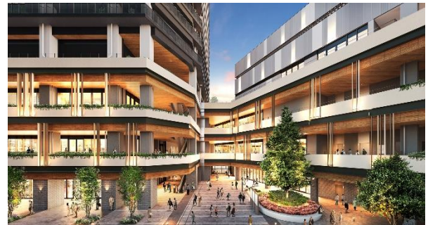
基壇部施設「J& MALL(ジェイトモール)」完成予想 CG①