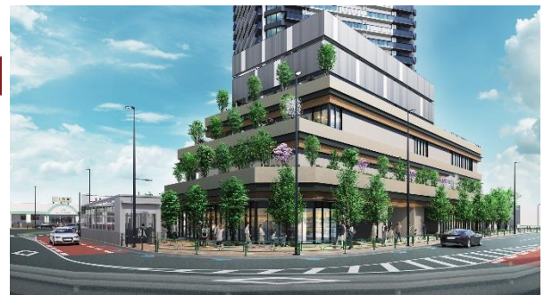
基壇部施設「J& MALL(ジェイトモール)」完成予想 CG②