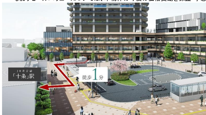
駅前広場完成予想 CG

※5. 2009年10月～2012年9月に新規分譲され、2020年10月～2021年9月に中古流通した分譲マンションを対象に新築分譲価格からの価格維持率(リセールバリュー)を算出したものです。専有面積30㎡未満の住戸および事務所・店舗用ユニットは集計から除外しております。なおリセールバリューについては、本物件の今後の価格変動を保証・予想するものではありません(2021年11月東京カンテイ調べ)。