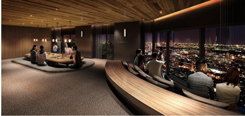
スカイラウンジ完成予想 CG

建物内共用部の壁面や天井の一部に解体材を採用し、共用廊下にはリサイクル材を加工したカーペットタイルや、商品の長寿命化や軽量化により環境負荷を低減した壁紙を採用し、低炭素社会に貢献しています。