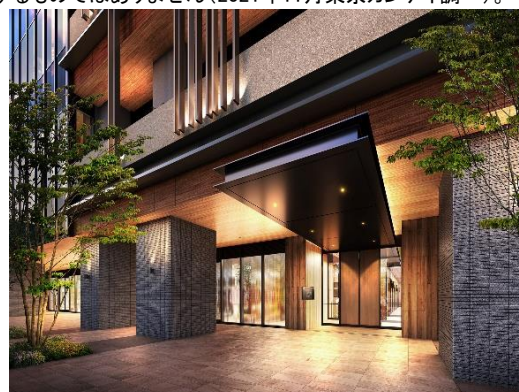
住宅エントランス完成予想 CG