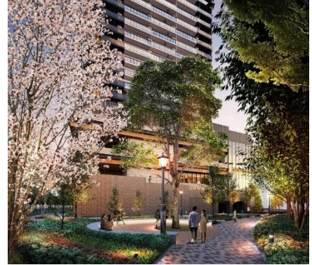
フォレストプロムナード完成予想 CG