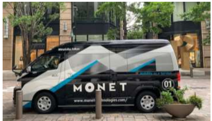
▲マルチタスク車両の外観イメージ