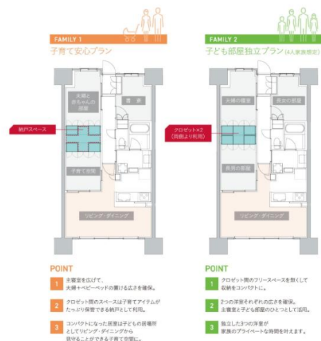
ウゴクロ イメージ図

家族が思い思いの時を過ごすマルチスペース。趣味や家事・子どもの勉強など、気軽に利用できる家族のシェア空間に。