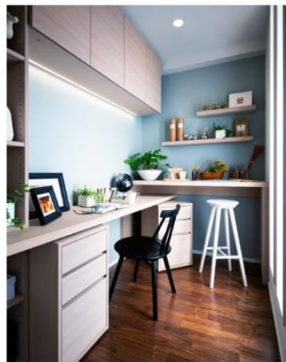
モアトリエ イメージ図

家族が思い思いの時を過ごすマルチスペース。趣味や家事・子どもの勉強など、気軽に利用できる家族のシェア空間に。