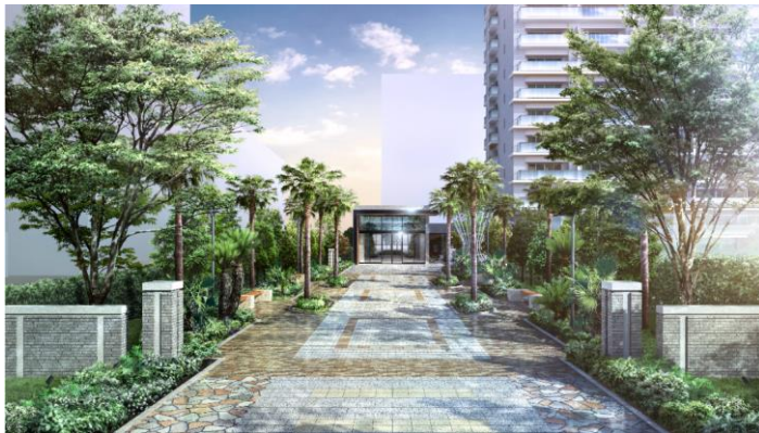
エントランスアプローチ

敷地面積 18,000 ㎡超のゆとりある敷地を活かし、「ららぽーと海老名」を目の前にする都市の中心にありながら潤い豊かな環境を創造しました。木々に迎えられる敷地入口の「ゲートアベニュー」や、居住者や地域の方々の散歩や遊び場として利用できる約 3,000 ㎡の広大な「提供公園」など、敷地内に 10 のガーデンを設えました。住まいの中にながらにして緑の潤いに浸る健やかな日常を叶えます。また、公園内では、コミュニティの中核として公園を利用したイベントの開催も予定しています。