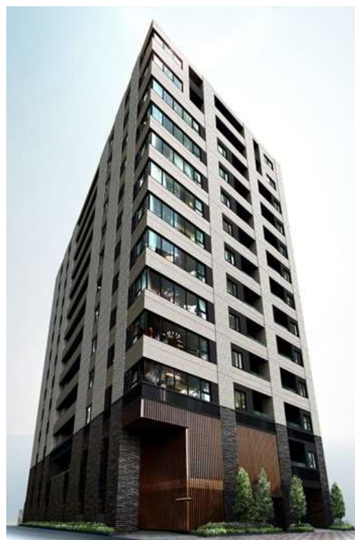
『リビオレゾン月島ステーションプレミア』完成予想CG