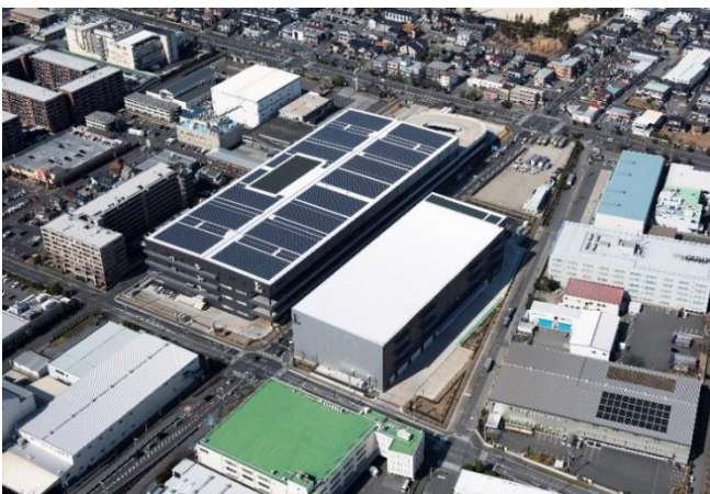
空撮 (左)『LOGIFRONT越谷Ⅰ』 (右)『LOGIFRONT越谷Ⅱ』