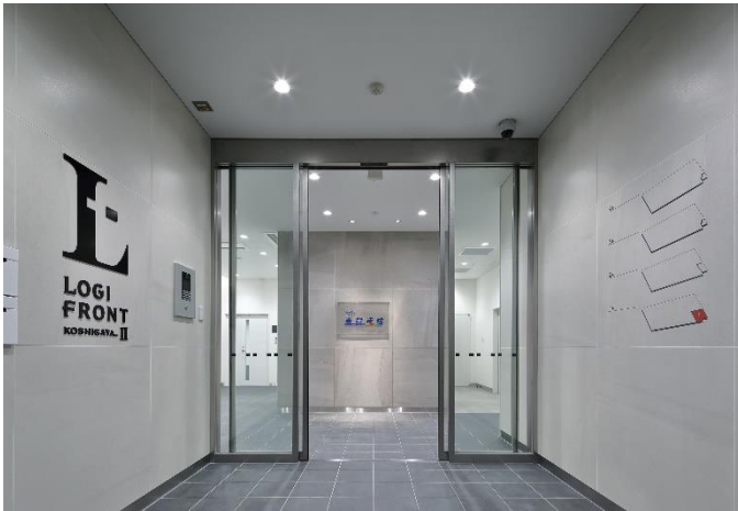
『LOGIFRONT 越谷 II』エントランス