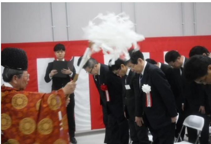
『LOGIFRONT 越谷 II』竣工式 神事の様子