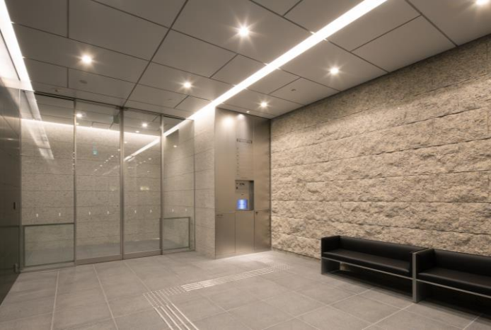
▲1階エントランスホール