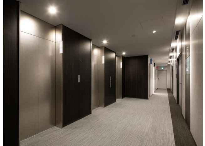
▲基準階エレベーターホール