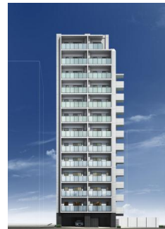
リビオレゾン東銀座