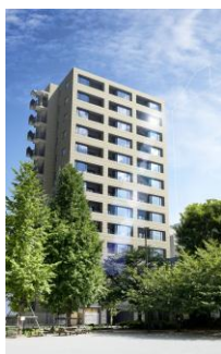
リビオ東京日本橋