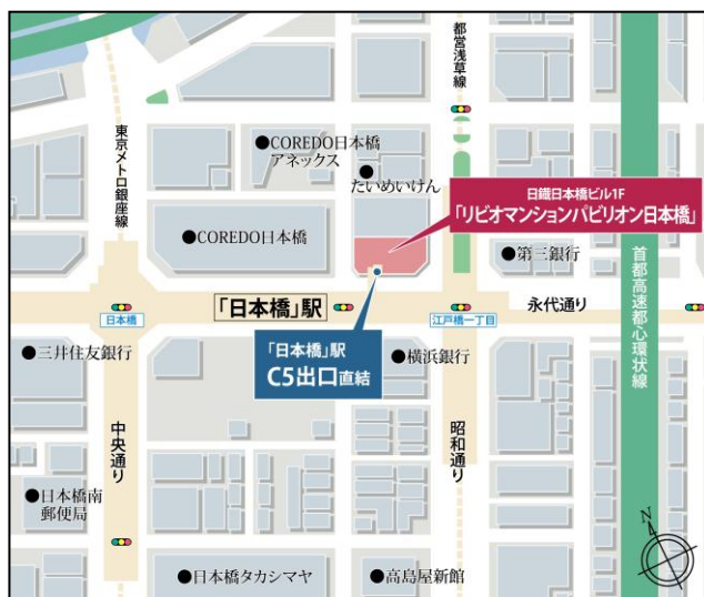
「リビオマンションパビリオン日本橋」MAP