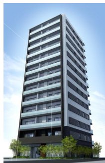
リビオレゾン大手町