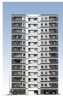
リビオレゾン千代田 岩本町ザ・レジデンス