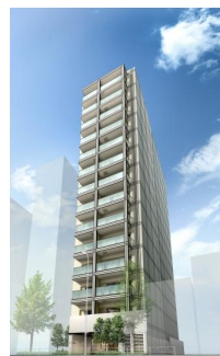
リビオレゾン浅草橋