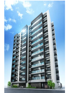
リビオレゾン人形町