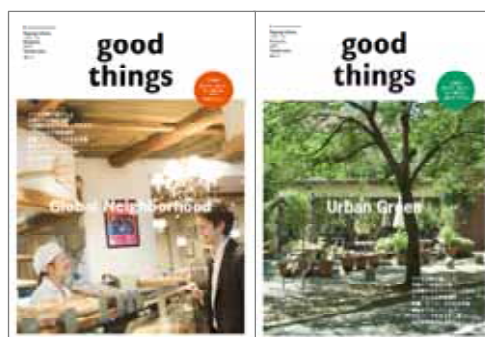
「good things」表紙(両面)イメージ

当エリアは1986年のアークヒルズ開業を機に、国内外を代表する企業が集積する国際的なビジネス拠点へと進化。以降、地下鉄開通などの交通インフラ整備とともに、泉ガーデン、赤坂インターシティ、アークヒルズ 仙石山森タワーなどの大規模開発が進みました。この30年、従来からもつ歴史的・文化的背景と共に、再開発で育まれた豊かな緑によって、国際色豊かで良好な住環境を有する都心でも希少なエリアへと大きく変貌。現在も六本木三丁目東地区プロジェクトや赤坂インターシティ AIR(赤坂一丁目プロジェクト)など、複数のプロジェクトが進行中です。