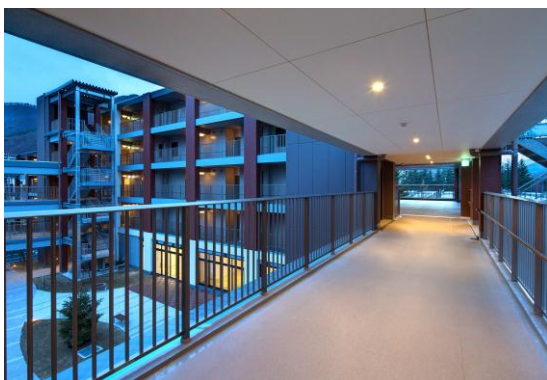
写真 3: フロアをつなぐデッキ