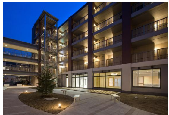
写真 2: 居心地の良い公園を思わせる中庭