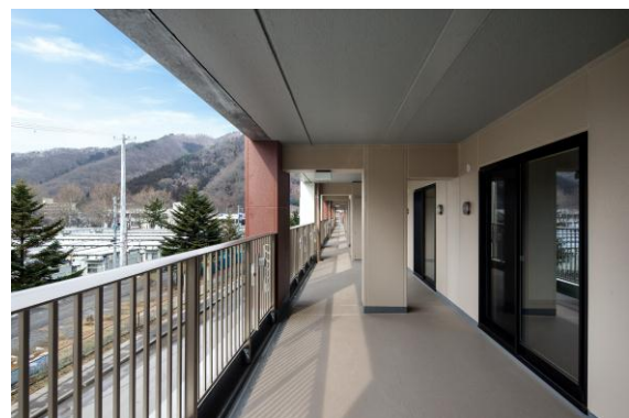
写真 4: 日常でのコミュニティ形成を促すコモンバルコニー