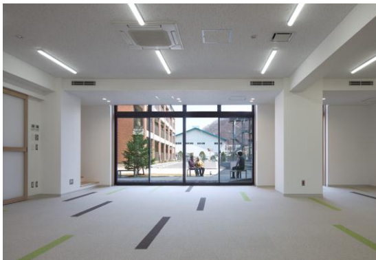
写真 1: 地域の交流拠点となる集会所