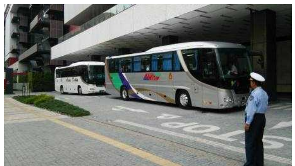
↑ インセンティブツアーの様子(北館1階車寄せ)