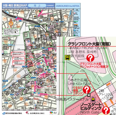
「大阪・梅田 駅周辺 MAP」