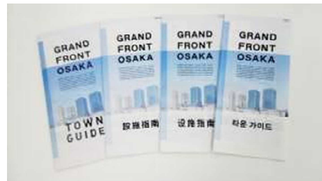
タウンガイド冊子