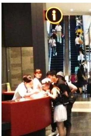
インフォメーションでの対応の様子