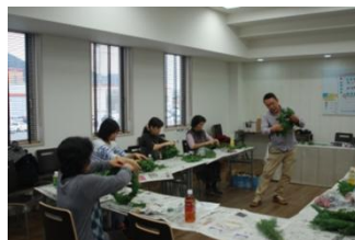
会議・教室・セミナーができる ミーティングルーム