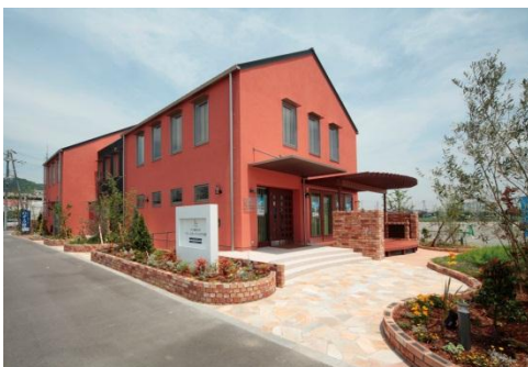
交流の核となるコミュニティハウスには 清掃や巡回等を行うコミュニティ マネージャーが常駐し、住民をサポート