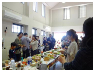
サロンで開かれた パーティーの様子