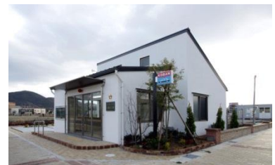
街を見守る交番を街の中心に配置。 土地は管理組合が所有し借地料を 得る仕組みを取り入れています