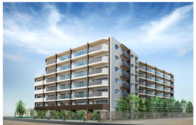
リビオ浦和領家 完成予想CG画像

定期借地権は50年間が一般的ですが、本物件の借地期間は「70年間」に設定されているため、二世代にわたる土地利用も可能です。また、土地所有権付き住宅と同様に、売却・賃貸・相続が可能です。一般の所有権付き住宅に比べ、土地利用の権利取得にかかる費用を少なく抑えることができます。