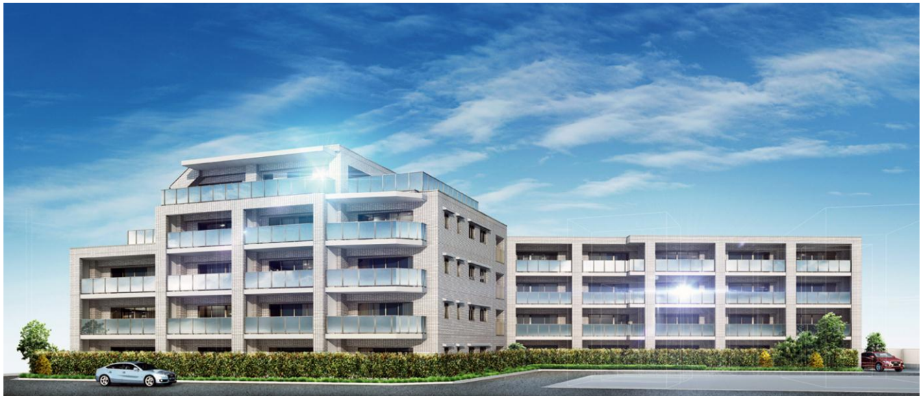
『リビオ平和台』完成予想図