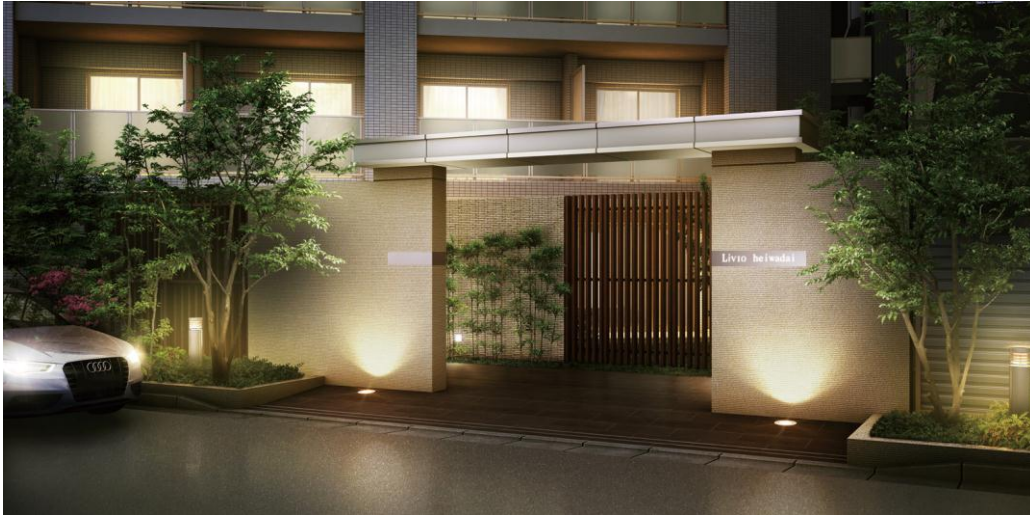
エントランス外観完成予想図