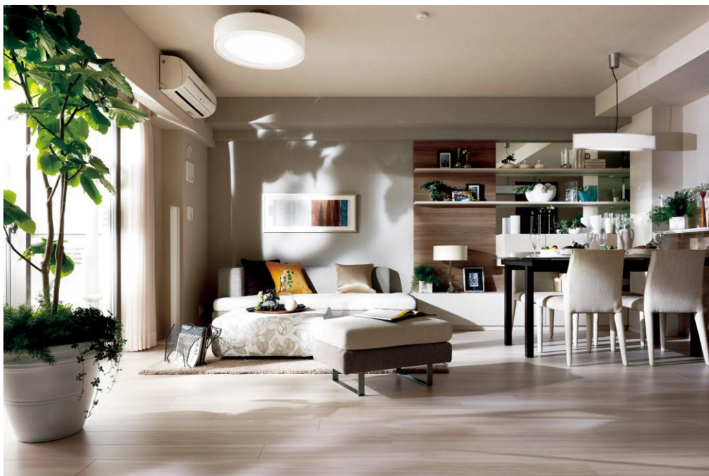
センターオープンサッシュの採用によりふんだんに陽光が差し込むリビングダイニング