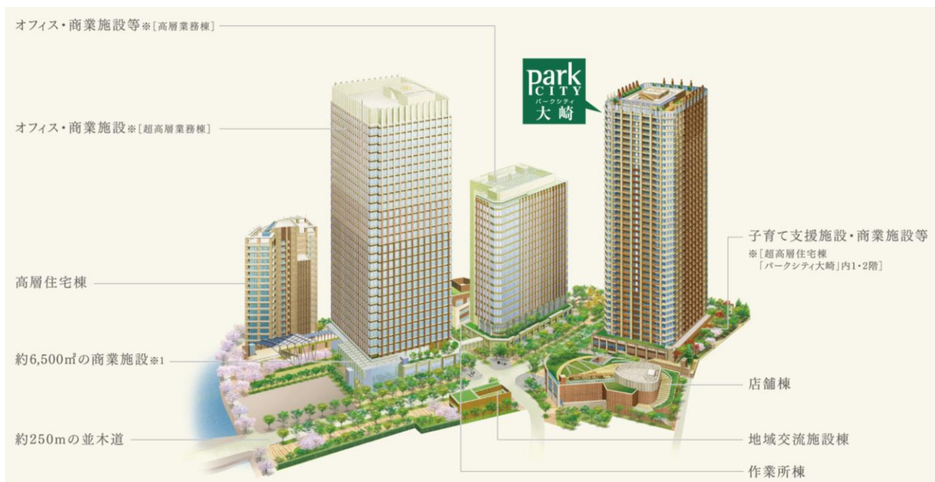
「北品川五丁目第1地区」全体完成予想イラスト

「パークシティ大崎」は、JR山手線内側で最大級(*1)となる約3.6haの開発面積を有するオフィス・商業施設・マンションが一体となった大規模複合再開発「北品川五丁目第1地区」のランドマークとして誕生予定、総戸数734戸・地上40階建てのタワーマンションです。経年優화를めざす環境創造型大規模開発住宅「パークシティ」ブランドとしてJR山手線内側で初(*2)となる「パークシティ大崎」は、都心の利便と緑溢れる環境の両立を図り、東京の新しい姿を未来へ届けることをめざします。