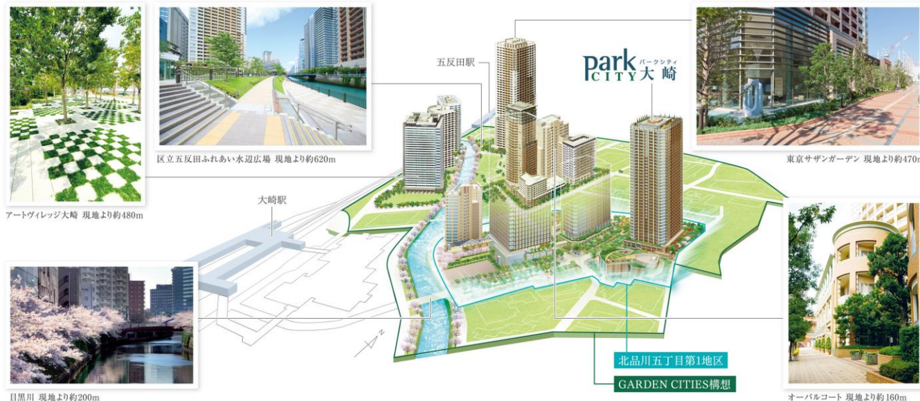
「GARDEN CITIES 構想」概念図

現在、大崎駅周辺エリアでは東京都副都心計画として開発面積約29ha（＊3）におよぶ大規模市街地再開発事業が進められています。昭和55年から始まったこのビッグプロジェクトは、“緑地空間の連続体となる街づくり”をコンセプトにした「GARDEN CITIES構想（＊4）」のもと「アーバンデザインガイドライン（＊5）」が策定され、街としてのまとまりに配慮した開発が進められてきました。「パークシティ大崎」が位置する「北品川五丁目第1地区」は、この大規模再開発のフィナーレを飾るフラッグシップ・プロジェクトとして開発が進められています。