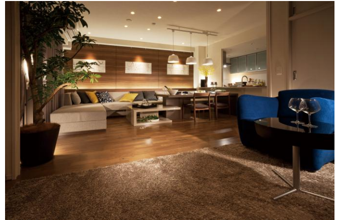
〈リビング・ダイニング・ルーム〉