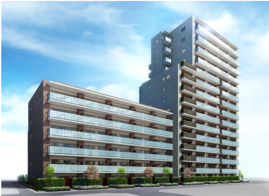
〈ハミングテラス 完成予想CG画像〉

本物件は、日暮里・舎人ライナー「高野(こうや)」駅から徒歩1分(約15メートル)、JR山手線「西日暮里」駅から徒歩7分に立地し、「大手町」駅まで17分、「東京」駅まで22分でアクセスが可能。また、足立区は、東京23区内で最大面積を誇る「舎人公園」を擁し、物件周辺にも「荒川江北橋緑地」や「見沼代親水公園」が徒歩圏にそろう、利便性と豊かな自然環境を兼ね備えた住環境にあります。