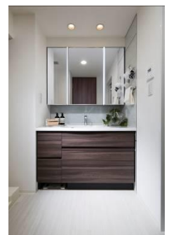
オリジナル洗面化粧台

※「+ONE LIFE LAB」公式サイト : http://plusonelife-lab.jp/