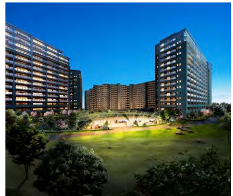
ウェルカム!プラザ

このニュースリリースに関するお問い合わせ先 株式会社大京 広報・IR室（伊奈・斉藤）TEL：03-3475-3802