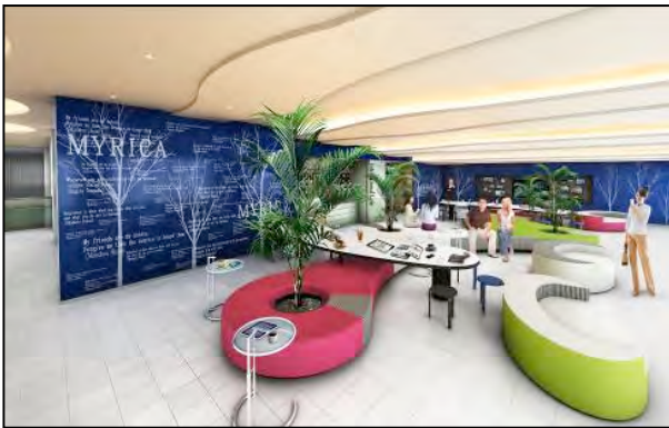
インターナショナルカフェ